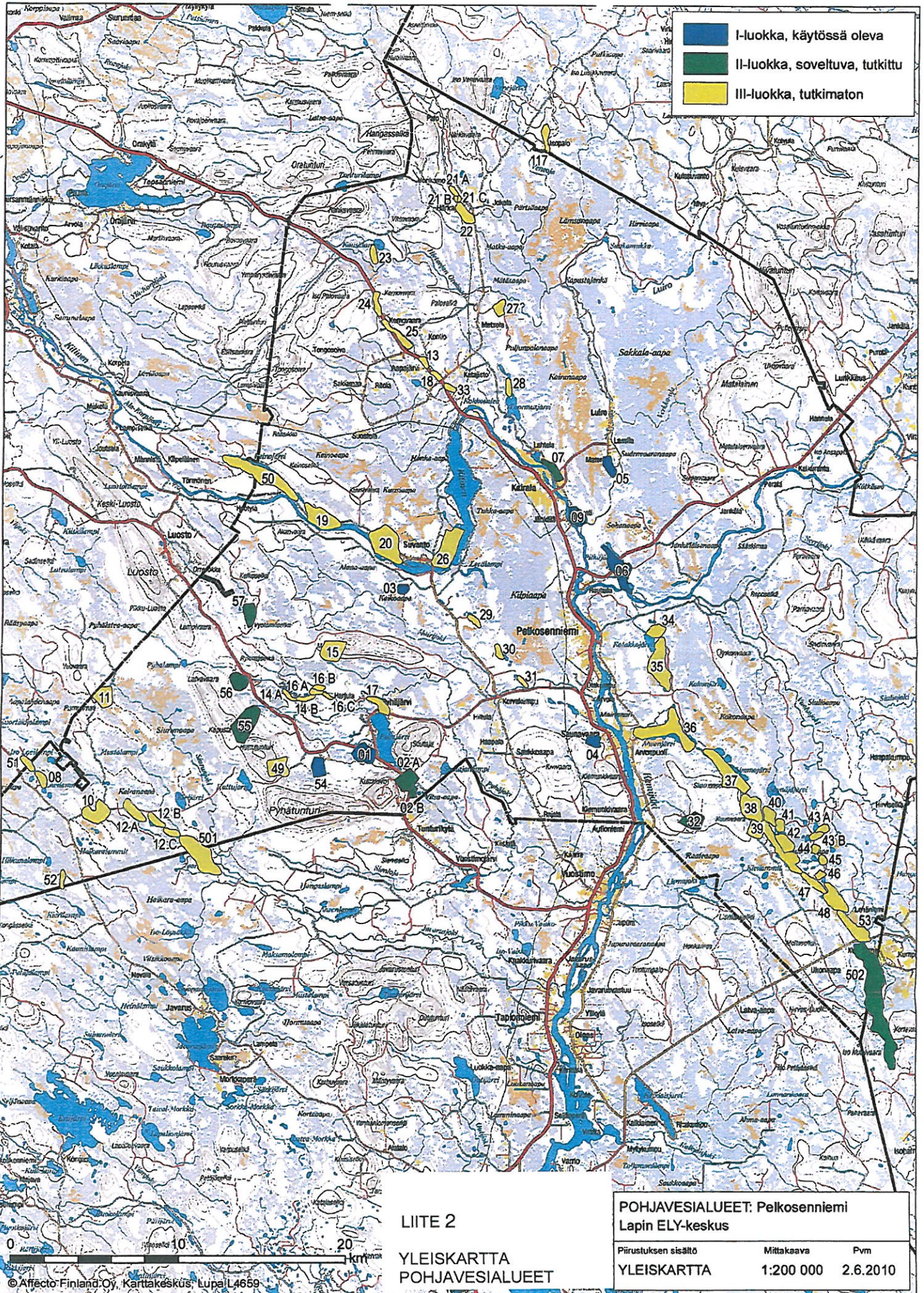
LIITE 2 YLEISKARTTA POHJAVESIALUEET